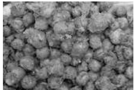
बुआई पूर्व उपचार — गोबर के घोल में डुबाना